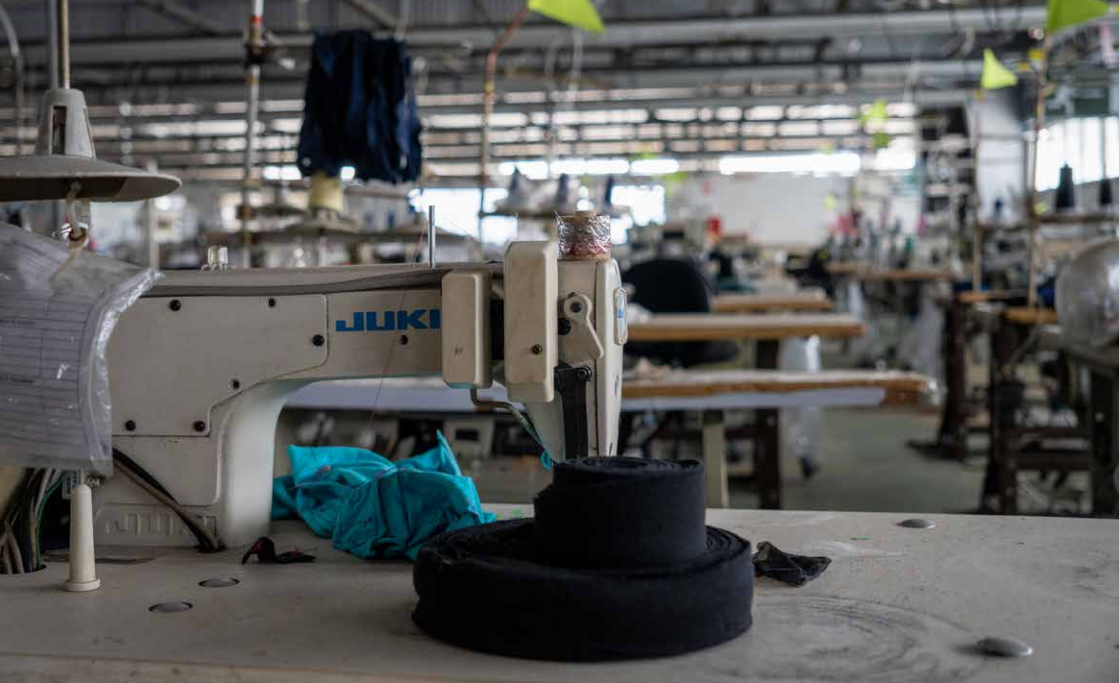
En collaboration avec Ormusa, Brücke Le Pont défend les droits du travail dans le secteur textile. Photo : une usine textile abandonnée au Honduras.

Parallèlement, les personnes expulsées des États-Unis trouvent à leur arrivée peu de programmes de réinsertion, peu ou pas de reconnaissance des compétences acquises à l'étranger, des obstacles à l'accès aux emplois socialement protégés et des services publics limités. Il est de toute façon trompeur de parler de « réinsertion ». De nombreux centraméricain·es ont migré précisément parce qu'ils et elles n'ont jamais eu de véritable garantie de travail équitable dans leur pays d'origine. L'absence de mesures publiques pour l'intégration socio-économique exacerbe le problème, car les États d'Amérique centrale ne disposent pas de mécanismes étendus pour accueillir, soutenir et intégrer les personnes expulsées.